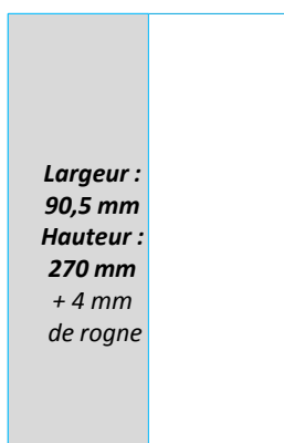
1/2 PAGE HAUTEUR