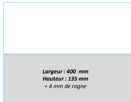
DOUBLE 1/2 PAGE HORIZONTALE