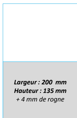
1/2 PAGE LARGEUR