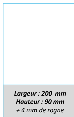
1/3 PAGE LARGEUR