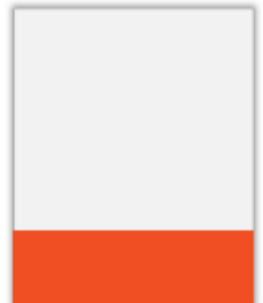
1/4 Page Largeur PP H 71 x L 230