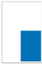
1/4 Page Hauteur H 225 x L 141