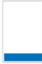
Bandeau cahier général et cote H 55 x L 287