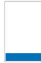
Médium bandeau H 55 x L 287