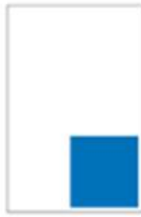
1/6 Page H 145 x L 141