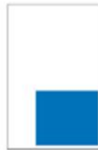
1/4 Page Carré H 192 x L 160