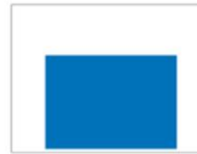
Double News H 272 x L 404