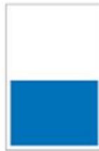
1/2 Page largeur H 215 x L 287