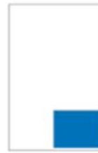
1/8 Page Carré H 109 x L 141