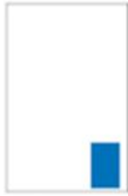
Premium H 115 x L 68