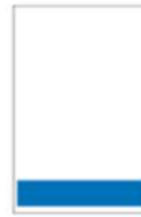
1/8 Page Bandeau H 55 x L 287