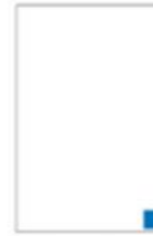
Mini cahier Cote H 59 x L 68