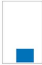
Medium H 105 x L 138