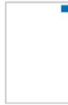
L'Oreille H 59 x L 68