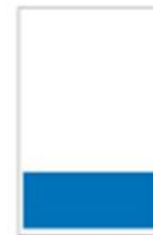
1/4 Page bandeau H 108 x L 287