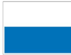
Double 1/2 Page H 215 x L 598