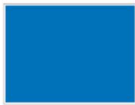
Double Page H 430 x L 598