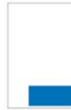
1/8 Page Largeur H 62 x L 190