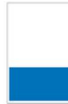
1/3 Page Bandeau H 145 x L 287