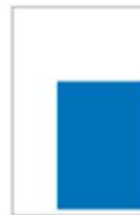
News H 272 x L 190