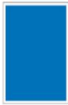
Page H 430 x L 287