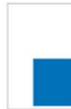
1/3 Page Carré H 215 x L 190