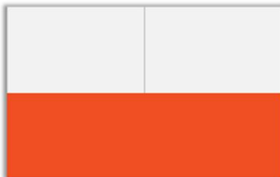
Double 1/2 Page H 143 x L 460