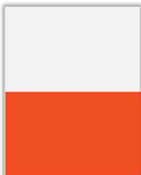
1/2 Page Largeur PP H 143 x L 230