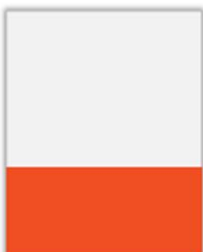
1/3 Page Largeur PP H 95 x L 230